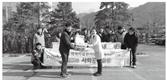
12월 1일 우체국 시설관리팀에서 바닥왁스작업 및 주변시설 청소 봉사와 생필품 후원을 해주셨습니다.