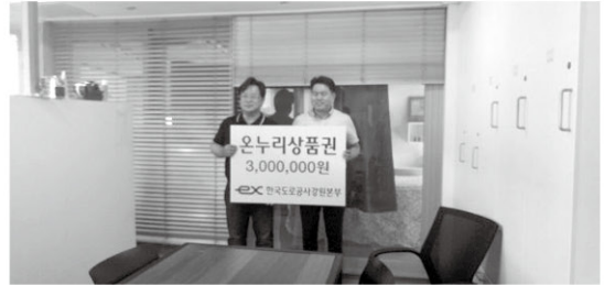
7월 20일 한국도로공사 강원본부에서 온누리 상품권 300만원을 후원해 주셨습니다.