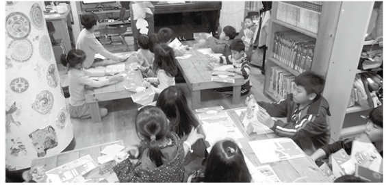
음식물 쓰레기 캠페인