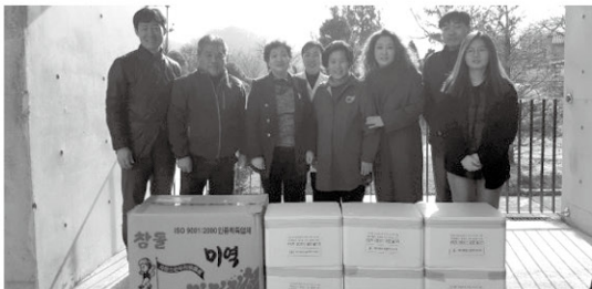
11월 15일 새마을문고 원주시지부에서 김치와 미역을 후원해 주셨습니다.