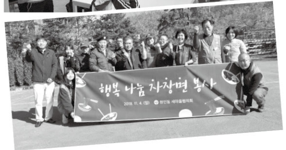
11월 4일 원인동 새마을협의회에서 오셔서 아이들에게 직접 맛있는 짜장면을 만들어 주셨습니다. 짜장면과 같이 가져오신 간식도 함께 먹으며 즐거운 시간을 보냈습니다.