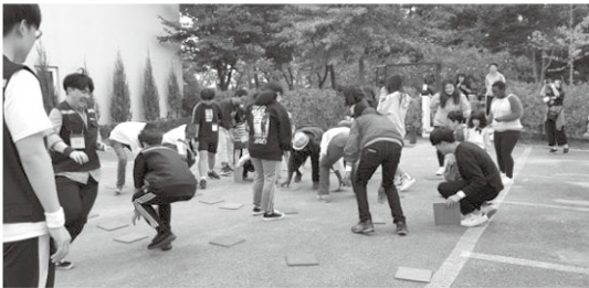
9월 26일 추석을 맞이하여 연세대학교 원주캠퍼스 머레이 봉사단과 코이카 학생들이 방문하여 아이들과 미니 운동회를 진행하였습니다. 모두 적극적으로 경기에 참여하며 신나는 하루를 보냈습니다.