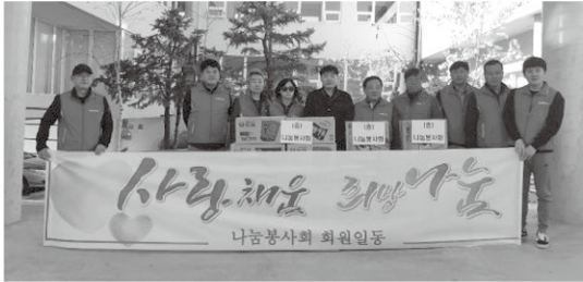
11월 3일 나눔봉사회 회원분들께서 라면을 후원해 주셨습니다.