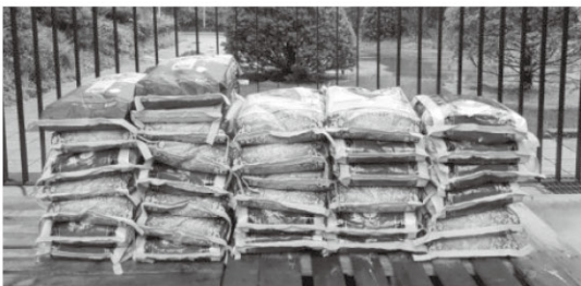
9월 20일 건강보험관리공단에서 쌀을 후원해 주셨습니다.