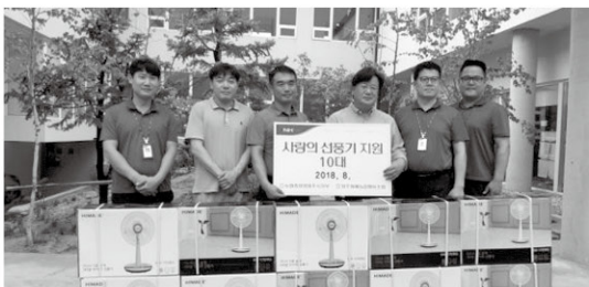
8월 30일 원주원예농협협동조합에서 선포기 10대를 후원해 주셨습니다.