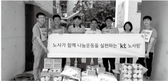
7월 17일 kt 노사랑에서 쌀과 라면을 후원해 주셨습니다.