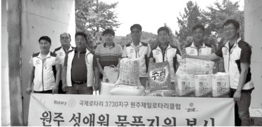
9월 14일 원주제일로타리클럽에서 생필품을 후원해 주셨습니다.