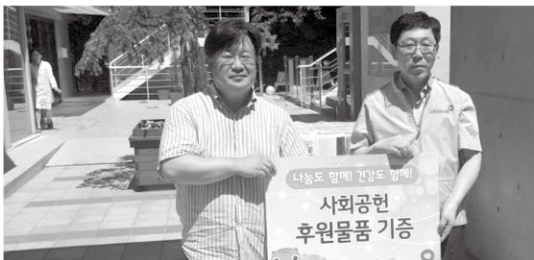
8월 1일 건강보험공단에서 생필품을 후원해 주셨습니다.