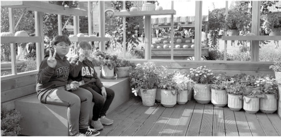
5, 6학년 여행