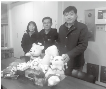
11월 19일 이용임 후원자님께서 인형을 후원해 주셨습니다.