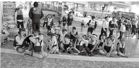
해오름꿈터 여름 캠프