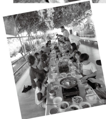
8월 18일 청향회 행사가 진행되었습니다. 후원자님들과 함께 등산과 물놀이하고, 맛있는 점심식사도 하며 즐거운 시간을 보냈습니다.