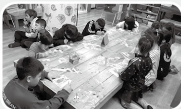
보석 십자수 액자만들기