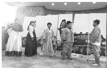
애네아의 집 방문 공연