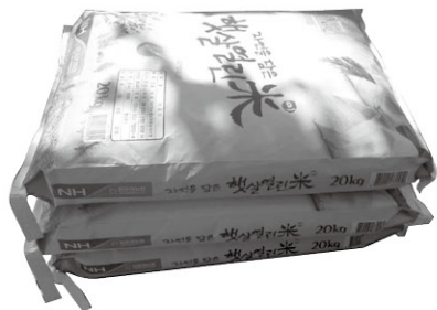
행복한 쌀길 사장님께서 쌀이나 간식 등을 후원해 주셨습니다.(7.3, 9.5)