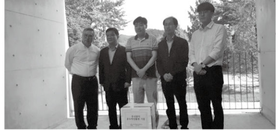
9월 18일 축산물품질평가원에서 돼지고기와 온누리 상품권을 후원해 주셨습니다.